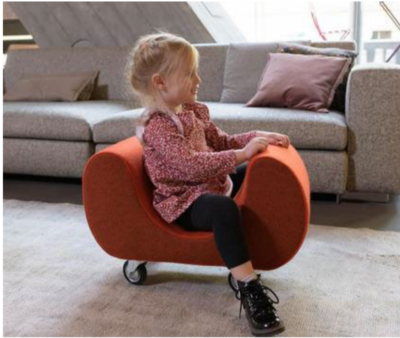
Børnemøblet "Kauch" er en slags mobil lænestol med hjul under, så barnet kan bevæge sig rundt som et legemøbel a la en gåvogn.

Årets udvalgte designere er kurateret af Tallin Design House, som har udpeget brands, der arbejder ud fra bæredygtige hensyn og smart brug af materialer.